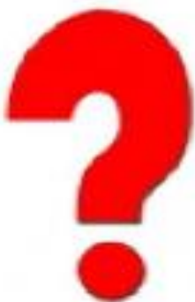
СХЕМА РАССКАЗА О ДИКИХ ЖИВОТНЫХ